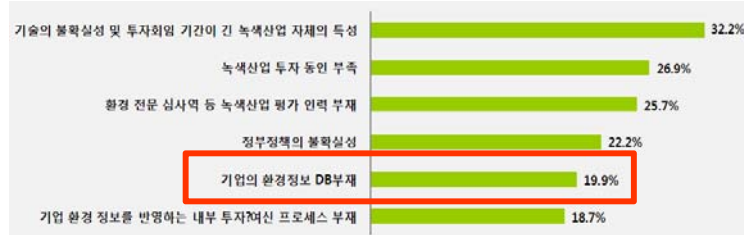
[ 국내 금융권 대상 설문조사 결과(2010년, 중복응답 포함) ]